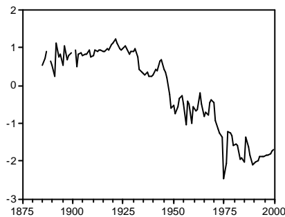
Gráfico 2: Evolución del Índice Reducido de Libertad Económica en Argentina: 1885-2000

¿Se corresponde la evolución del IRLE con los verdaderos hechos históricos de la económica argentina?